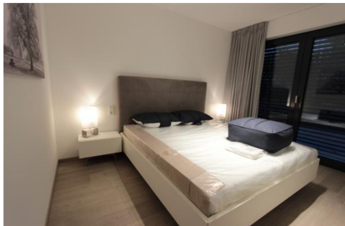
RESIDENCE PERTH APPARTEMENT 1